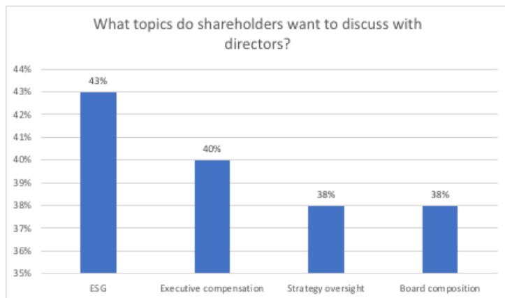
Figure 1

Bien que la lassitude soit une réaction légitime en des circonstances aussi éprouvantes que la pandémie de COVID-19, les conseils d'administration doivent être vigilants face au risque de régression de la gouvernance et, partant, face à la nécessité de prendre des mesures proactives pour renverser la tendance. Il leur faut en outre évaluer dans quelle mesure leur entreprise parvient à anticiper et à satisfaire les attentes des actionnaires, lesquels en appellent à davantage de changement et à un renforcement du devoir de rendre compte, en particulier dans le domaine ESG. Ils peuvent notamment solliciter l'audit interne afin qu'il leur apporte une assurance et des conseils pertinents et objectifs quant à la meilleure façon d'améliorer la qualité de la gouvernance d'entreprise.